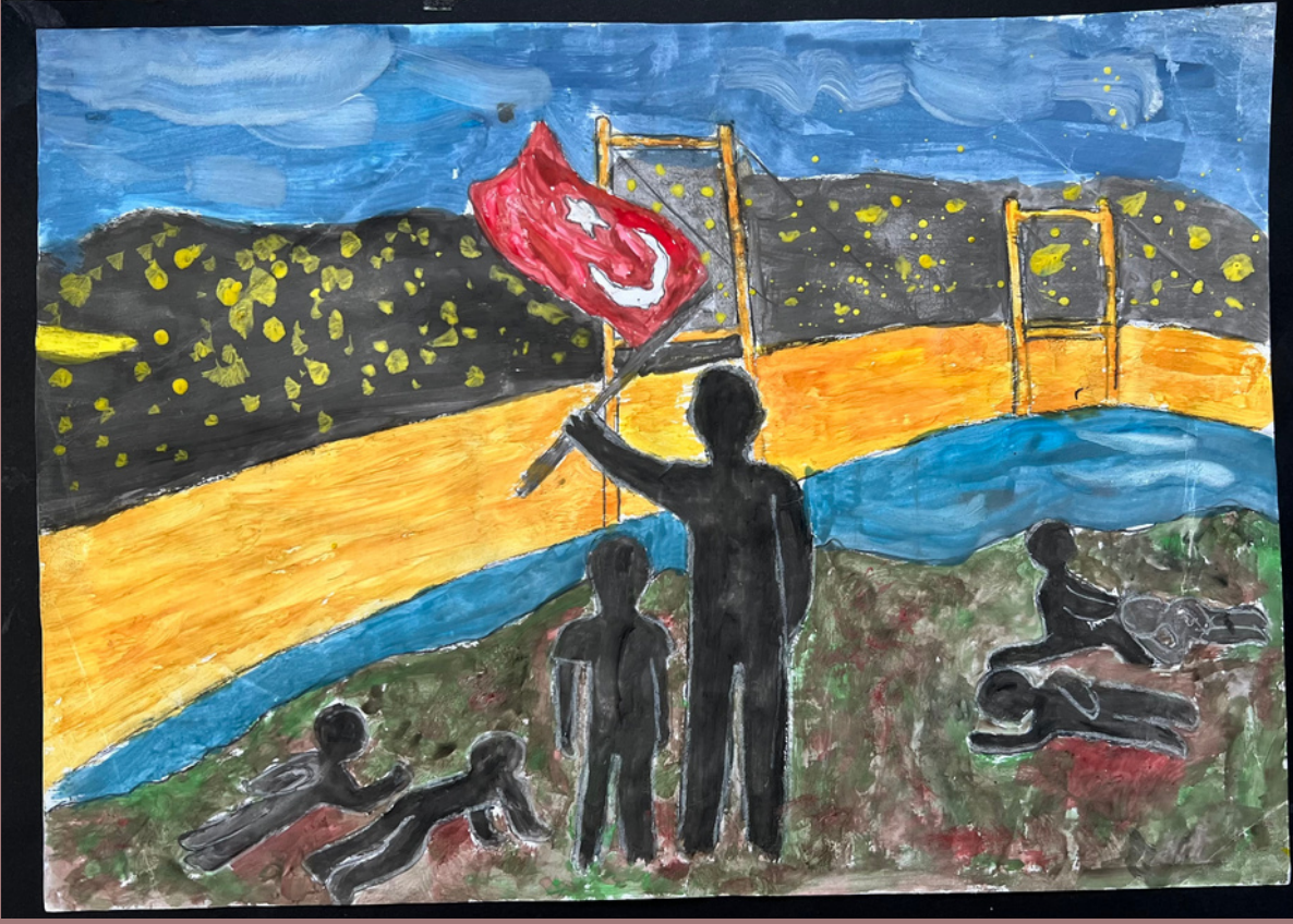
Aymelek ÇALIKOĞLU 7/A